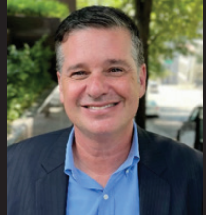
Greg Spotts 시애틀 교통국(Seattle Department of Transportation) 국장 (Director)