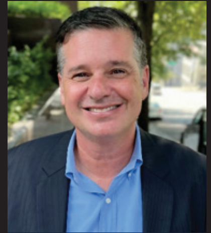
Greg Spotts 西雅圖交通部部長